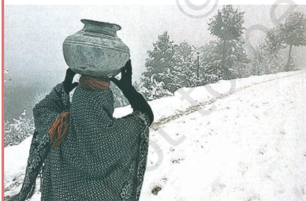
A Kashmiri earthquake survivor carries water in the snow in a devastated village.

एक ओर इजराइल जैसे 25 सेमी. औसत वार्षिक वर्षा वाले देश में जल का कोई अभाव नहीं है तो दूसरी ओर 114 सेमी. औसत वार्षिक वर्षा वाले हमारे देश में प्रति वर्ष किसी भाग में सूखा अवश्य पड़ता है। देश में जल की उपलब्धता और उसके स्वरूप के अनुसार समुचित जलप्रबंधन न होने के कारण ही वर्षा का जल नदी-नालों में तेजी से बहकर समुद्र में चला जाता है जिससे वर्षा के बाद के लगभग नौ महीने देश के लिए पानी की कमी के होते हैं। ये ही मूल कारण हैं देश में जलीय अभाव के, जिसे हम उचित प्रबंधन के द्वारा ही नियंत्रित कर सकते हैं।