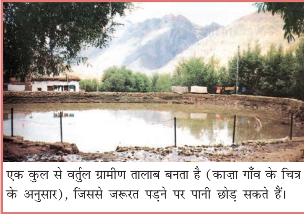
एक कुल से वर्तुल ग्रामीण तालाब बनता है (काजा गाँव के चित्र के अनुसार), जिससे जरूरत पड़ने पर पानी छोड़ सकते हैं।