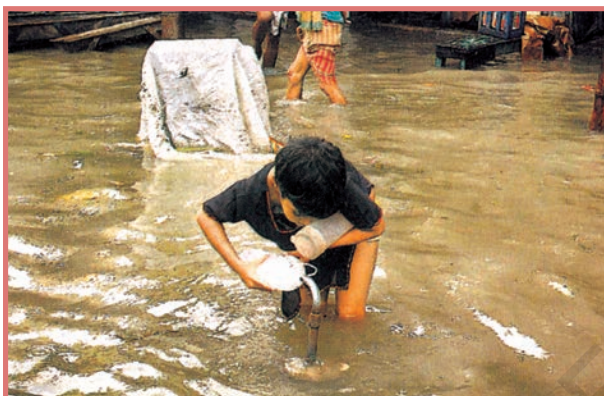
WATER, WATER EVERYWHERE, NOT A DROP TO DRINK: After a heavy downpour, a boy collects drinking water in Kolkata. Life in the city and its adjacent districts was paralysed as incessant overnight rain, measuring a record 180 mm, flooded vast areas and disrupted traffic.

वितरण का परिणाम हो सकता है। जल, अधिक जनसंख्या के लिए घरेलू उपयोग में ही नहीं बल्कि अधिक अनाज उगाने के लिए भी चाहिए। अतः अनाज का उत्पादन बढ़ाने के लिए जल संसाधनों का अतिशोषण करके ही सिंचित क्षेत्र बढ़ाया जा सकता है और शुष्क ऋतु में भी खेती की जा सकती है। सिंचित कृषि में जल का सबसे ज्यादा उपयोग होता है। शुष्क कृषि तकनीकों तथा सूखा प्रतिरोधी फसलों के विकास द्वारा अब कृषि क्षेत्र में क्रांति लाने की आवश्यकता है।