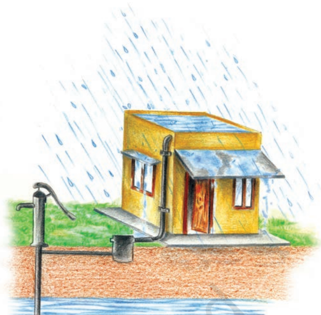
(अ) हैंडपंप के माध्यम से पुनर्भरण