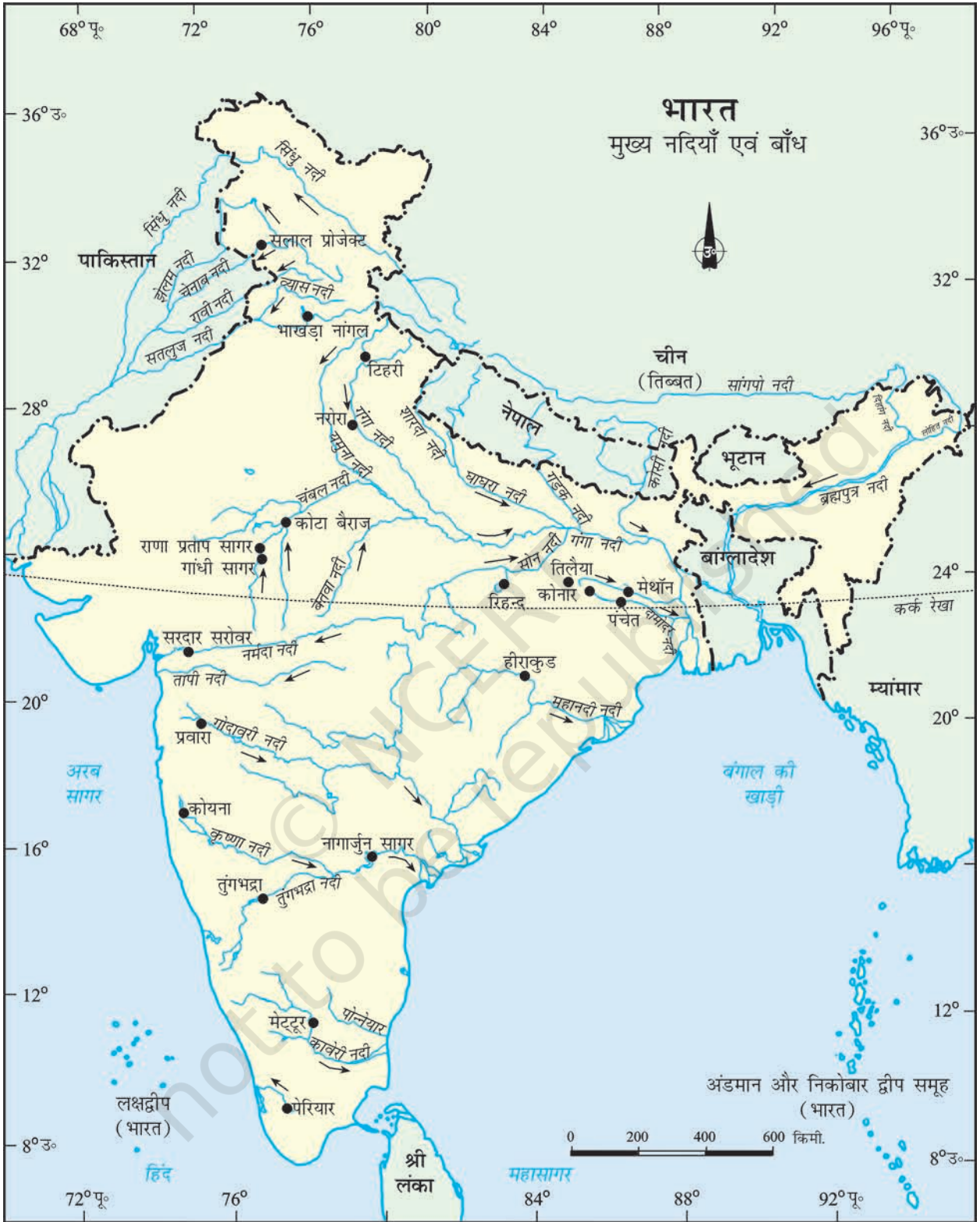
भारत - मुख्य नदियाँ और बाँध