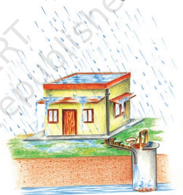
(ब) बेकार पड़े कुएँ के माध्यम से पुनर्भरण